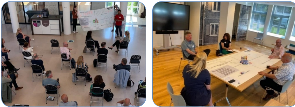
In het Wereldcafé gaan partners met elkaar in gesprek over wat er nodig is in Leidschendam-Noord.

Financiële zelfredzaamheid: Armoede is een groot probleem in deze wijken. Werken is nog niet vanzelfsprekend. Veel kinderen groeien op in armoede. Er zijn verschillende drempels om mee te doen. Het beroep op zorg en begeleiding is hoger dan gemiddeld in Leidschendam-Voorburg. Andersom geldt dat het vertrouwen van een deel van de inwoners in de overheid laag is, waardoor zij geen aanspraak maken op zorg/ondersteuning. Niet iedereen kan meekomen op het gebied van taal. Hierdoor vinden inwoners de weg naar ondersteuning niet automatisch. Aanbod is vaak kortdurend en organisaties zijn niet altijd op de hoogte van elkaars aanbod.