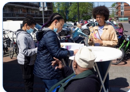
Met inwoners wordt gesproken over Leidschendam-Noord. In een stembiljet geven inwoners aan wat zij het belangrijkste vinden.