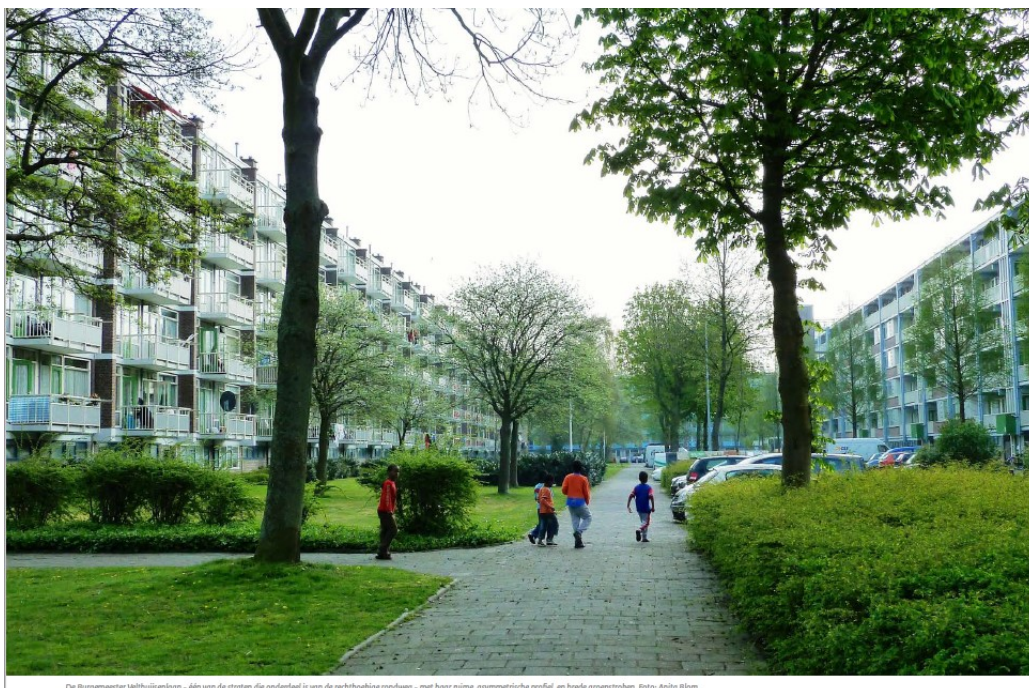
Die Burgemeester Velthuisplein - één van de straten die onderdeel is van de rechthoekige rondweg - met haar ruime, asymmetrische profiel en brede groenstroken.

In Prinsenhof staan in totaal 2675 woningen. De wijk bestaat uit de buurten Prinsenhof laagbouw en Prinsenhof hoogbouw. De Heuvel/Amstelvijk telt 1774 woningen en de wijk bestaat uit de buurten De Heuvel Zuid, De Heuvel Noord en de Amstelvijk. De meeste van deze woningen zijn in de jaren '60 gebouwd. Beide wijken bestaan nagenoeg geheel uit etagewoningen 5 .