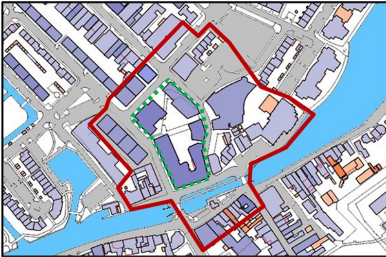
Figuur 3. Direct omwonenden parkeergarage Damplein

Uit de telcijfers van de parkeergarage blijkt dat er enige ruimte is om extra ontheffingen voor direct omwonenden van de parkeergarage uit te geven. Hiermee kan de capaciteit van de garage beter benut worden, wat ruimte schept op straat. Een aantal inwoners heeft aangegeven ook interesse te hebben in een ontheffing voor de parkeergarage Damplein.