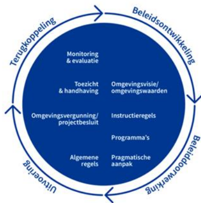
Figuur 1: Beleidscyclus Omgevingswet

De opbouw van de Omgevingswet volgt een beleidscyclus. De beleidscyclus biedt een structuur om de instrumenten van de Omgevingswet te ordenen. De beleidscyclus is beleidsontwikkeling, beleidsdoorwerking, uitvoering en terugkoppeling (zie figuur 1).